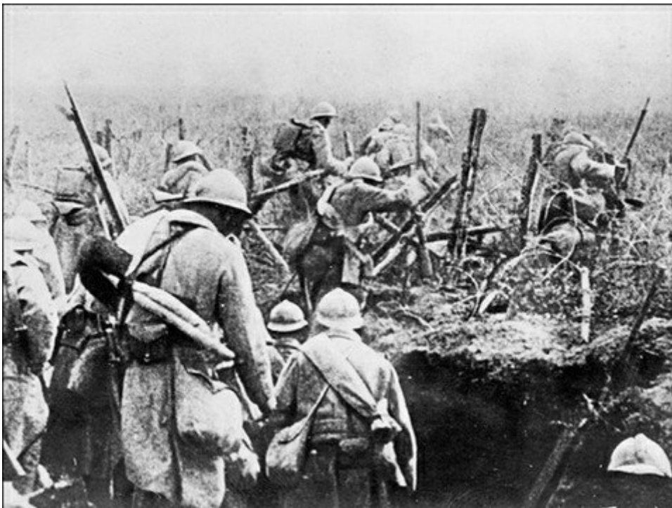
Photo prise en 1916 de soldats français passant à l'attaque depuis leur tranchée lors de la bataille de Verdun durant la Première Guerre Mondiale.

Cela ne t'a sans doute pas échappé ! Vendredi 11 novembre tu n'auras pas classe ! Mais, sais-tu pourquoi, en France, le 11 novembre est un jour férié ? Cette date fête l'armistice de 1918, qui mit fin aux combats de l'une des guerres les plus violentes de notre histoire. Pour commémorer cet événement, des fleurs seront déposées sur la tombe du soldat inconnu.