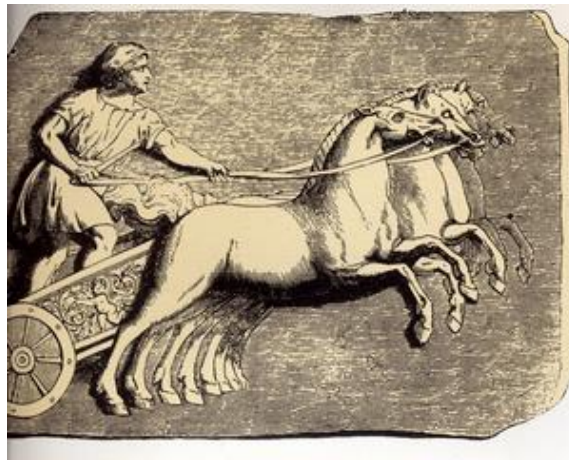
Course de chars

Dans le cirque, les courses de chars avaient lieu sur la piste ovale du cirque. Le cirque était aussi un bon divertissement pour les romains.