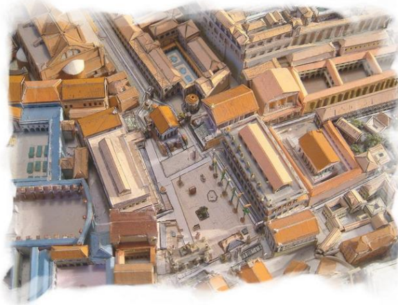
Le forum romain