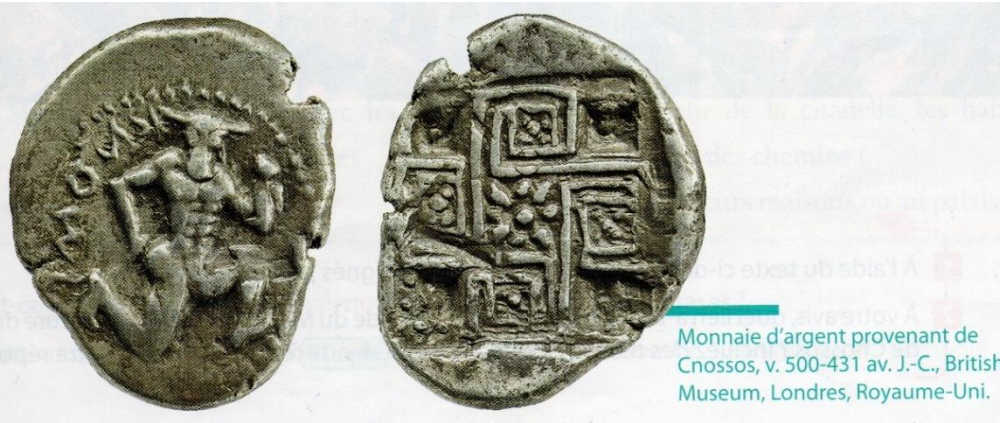
Monnaie d'argent provenant de Cnosso, v. 500-431 av. J.-C., British Museum, Londres, Royaume-Uni.