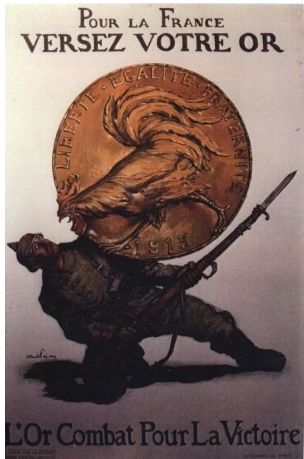
Affiche d'emprunt française, 1915

Pour continuer les combats et soutenir les dépenses militaires, les Etats encouragent les civils à prêter leur argent.