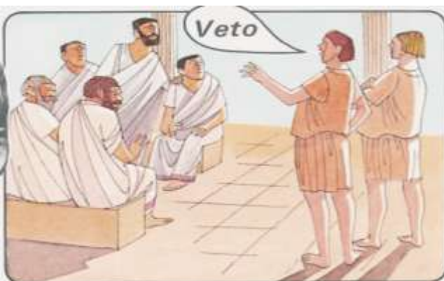
3. Les citoyens romains étaient soit de riches et puissants patriciens, soit des plébéiens, simples travailleurs sans pouvoir. En 494 av. J.-C., les plébéiens menacèrent de quitter Rome et de construire leur propre ville. Après quoi, ils furent autorisés à élire deux représentants, les tribuns, qui pouvaient empêcher toute action du Sénat en déclarant : Veto (je défends).