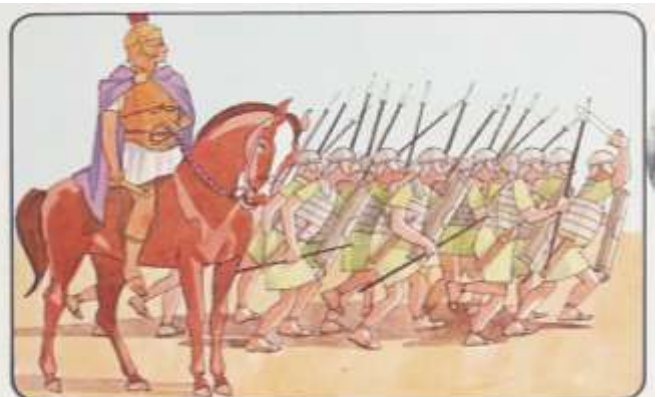
4. A mesure que grandissait l'Empire romain, les riches devenaient plus riches et les pauvres plus mécontents. Il y eut des émeutes et des guerres civiles. Les généraux victorieux se combattaient mutuellement, autant qu'ils combattaient les ennemis de Rome. La paix fut rétablie en 27 av. J.-C., quand Octave devint le premier Empereur romain sous le titre d'Auguste.