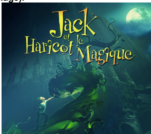
Partie de l'affiche du conte musical pop rock tiré du conte en 2003

Pour aller plus loin : il est possible de demander aux élèves de décrire à l'oral ou à l'écrit l'affiche et d'imaginer à quel moment du conte se déroule l'action : objectifs lexical et d'expression ( décrire une image).