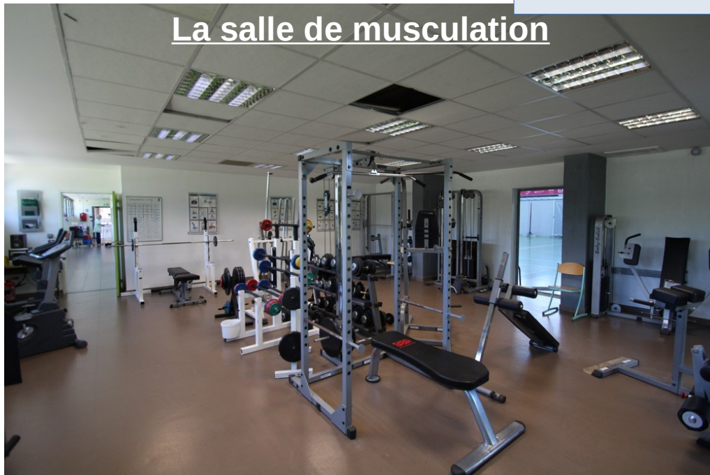
La salle de musculation