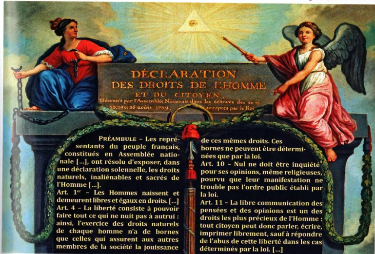
■ Peinture sur bois, musée Carnavalet, Paris. (Texte recomposé).

1 J'entoure en rouge ce qui limite ma liberté et protège celle des autres.