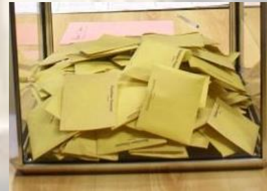
Des bulletins de vote