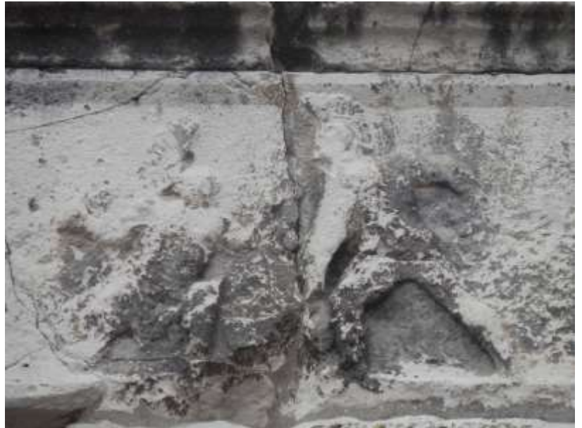
Combat de Gladiateurs