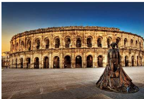
Panorama du parvis des arènes de Nîmes avec la statue du matador Niméno II

https://www.nimes-tourisme.com/images/articles/monuments/arenas-de-nimes/Photo_OT_N%C3%A5mes_ML_2.JPG