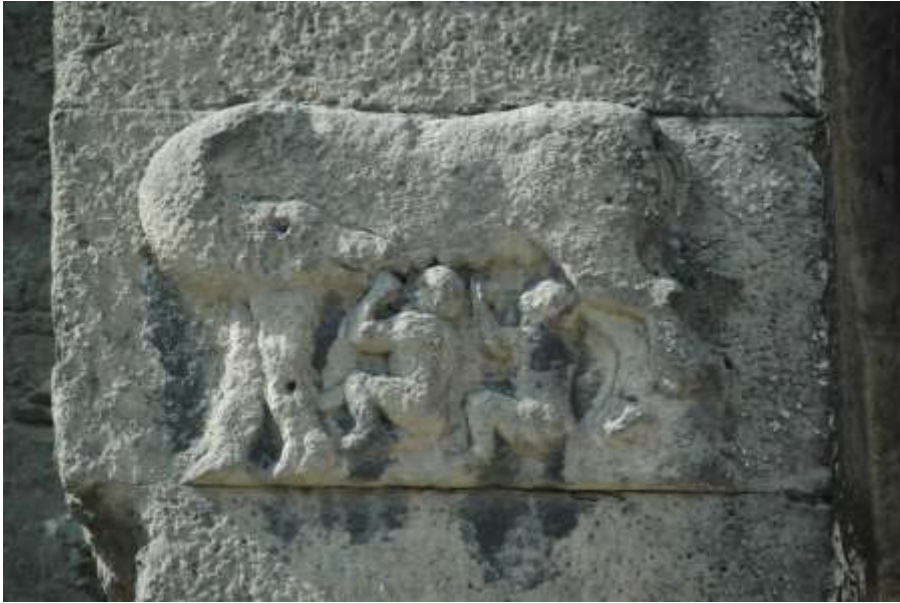
La Louve romaine allaitant Romulus et Rémus