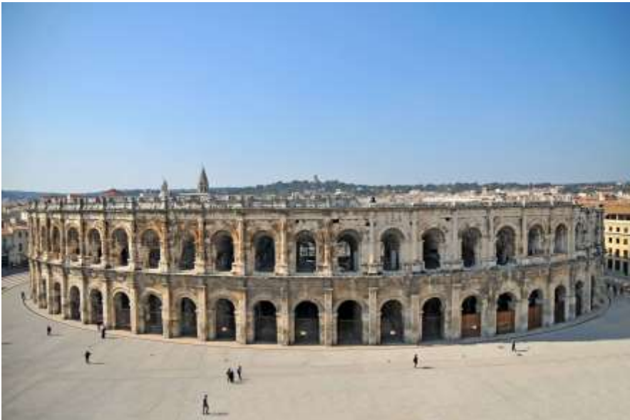
Vue extérieure des arènes

L'amphithéâtre de Nîmes, daté du 1er siècle de notre ère, est l'un des mieux conservés du monde romain.