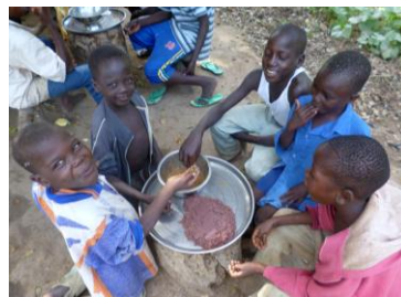
Repas partagé : « la boule ».

Pour plus d'infos et pour suivre l'actualité du centre : www.escalejeunes.fr/balimbatchad