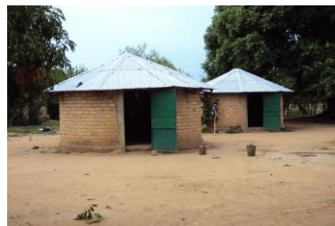
Deux des cases du centre (ils dorment à 9 par case)