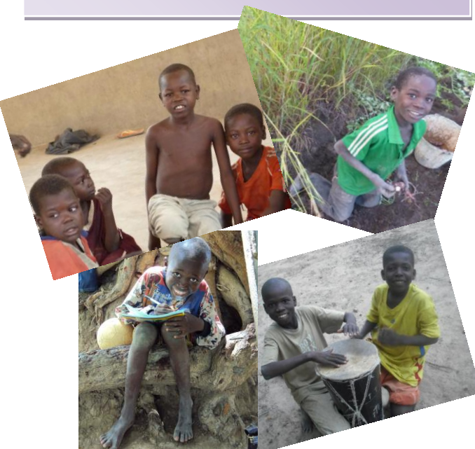
Quelques enfants du centre.