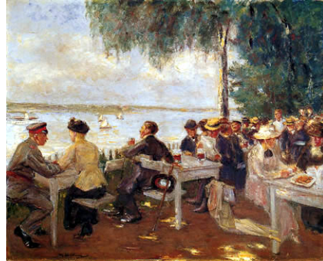
2. « Gartenlokal an der Havel » Max Lieberman 1916