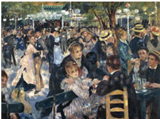
5. « Bal du moulin de la Galette » Pierre-Auguste Renoir 1876