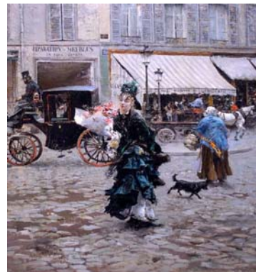
6. « Crossing the street » Giovanni Boldini 1875