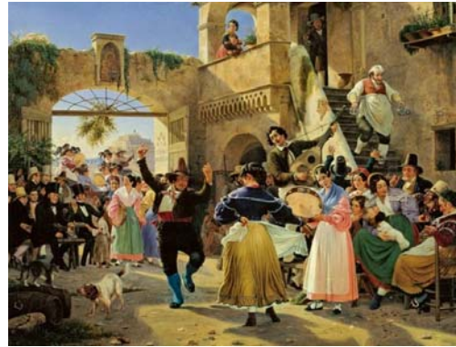
4. « Romerske borgere forsamlede til lystighed i et osteri » Wilhelm Marstran 1839