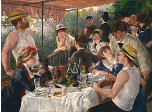
1. « Le déjeuner des canotiers » Pierre-Auguste Renoir 1880