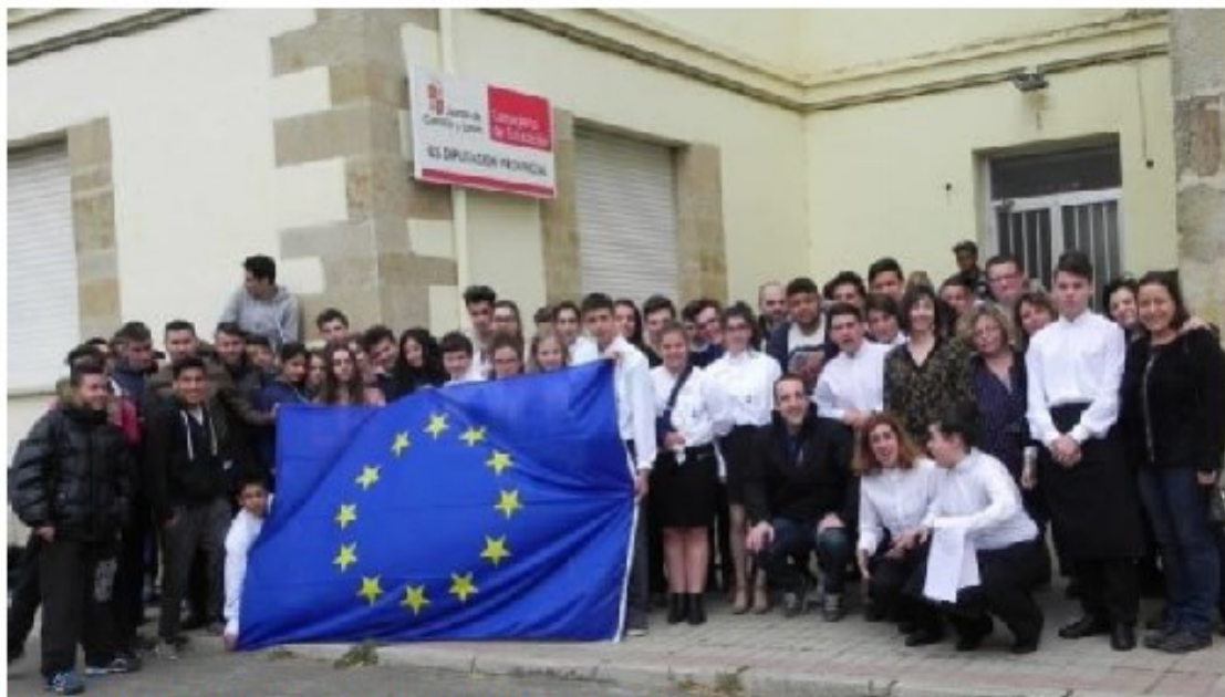
La expedición francesa está disfrutando este intercambio educativo

Llevan una semana y permanecerán hasta el 24 de marzo compartiendo las clases prácticas con los alumnos españoles