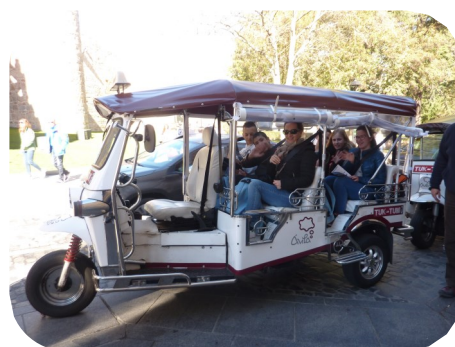
Visite d'AVILA en tuk-tuk