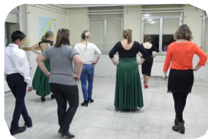
Initiation à la Sévillane