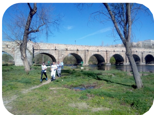
Petite séance de footing