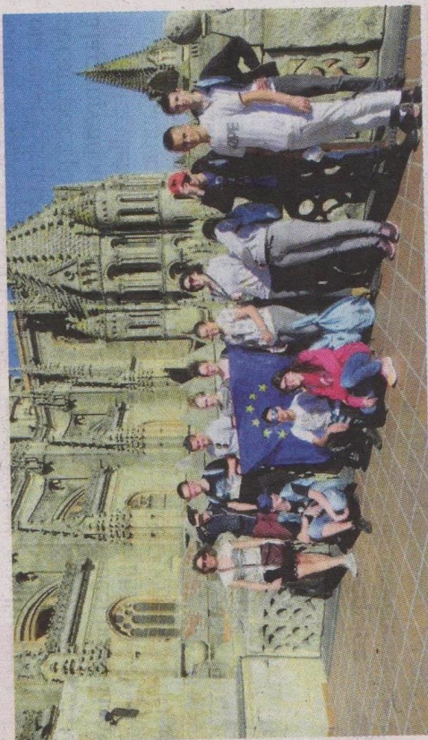
Les jeunes ont été intégré dans des classes et ont visité également la ville.

Accompagnés de quatre de leurs professeurs et d'une correspondante du Conseil départemental, les jeunes ont été hébergés en auberge de jeunesse et reçus dans le lycée professionnel l'IES Diputación Provincial et intégrés dans des classes, en tutorat avec les élèves espagnols. Ils ont également visité des entreprises locales, fabriques semi-industrielles, entre-