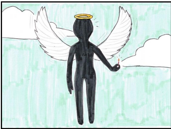
Dessin de Miya

Pour illustrer les conséquences que peut avoir un harcèlement scolaire, j'ai choisi aujourd'hui de vous parler d'un jeune homme dont l'histoire est tragique.