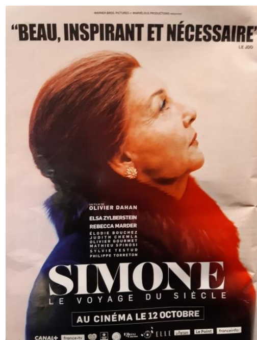
Affiche du film Simone . Photo Mme Quinson

Beaucoup en France, après les événements des États-Unis, parlent d'inscrire le droit à l'avortement dans la constitution, afin de protéger cette loi.