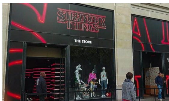
Photo du magasin

- Chaque épisode de la saison 4 a coûté 30 millions de dollars.