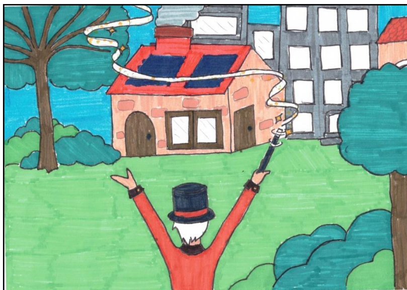
Dessin de Miya

L a reine d'Angleterre, Elizabeth II, est décédée le 8 septembre 2022. Son fils aîné est son successeur et, aujourd'hui, nous allons parler de lui : Charles III, ex Prince de Galles. Peut-être allez-vous découvrir des éléments intrigants que vous ignoriez auparavant... ☺