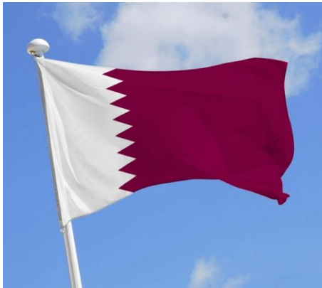
Drapeau du Qatar. Image clipart.

V ous en avez sûrement déjà entendu parler, la Coupe du monde de football 2022 se jouera au Qatar, du 20 novembre au 18 décembre. Cet événement réunira les meilleures équipes nationales du monde, qui se confronteront pour gagner le titre de champion du monde. Cette compétition, qui a été organisée par la FIFA, devait se passer, comme à son habitude, l'été, mais se jouera exceptionnellement en hiver, car les températures au Qatar (connu comme l'un des pays les plus chauds de la planète), ont atteint, par exemple, cet été un record de 48° : ce sont des températures injouables.