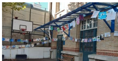
La grande lessive dans la cour.

C haque année ce projet est organisé dans le monde entier, avec un nouveau thème. Cette année le thème était « La couleur de mes rêves ». Cela consiste à dessiner un rêve, soit qu'on a vécu, soit qu'on voudrait vivre, et, dans ce dessin, il doit y avoir une couleur qui ressort davantage. Les œuvres peuvent être réalisées avec plein de matériaux différents : Legos, collages, crayons de couleur, de la peinture, de l'aquarelle, des feutres... Et elles ne vont pas être affichées sur des murs ou dans une classe, NON, elles doivent être suspendues sur un fil et attachées avec des pinces à linge dans la cour !