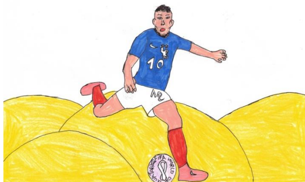
Dessin de Paul

Il est aussi constaté que la chaleur estivale au Qatar est une cause importante de décès. Les conclusions du journal, soutenues par l'Organisation internationale du travail des Nations Unies, ont aussi dévoilé que, durant 4 mois dans l'année, les travailleurs étaient exposés à un stress thermique (accumulation de chaleur dans l'organisme qui empêche le travailleur de maintenir une température corporelle normale). Cet article percutant et saisissant est l'un des premiers à parler de cette cause.