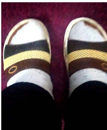
Même le père d'une de nos journalistes a succombé à la mode !

280 euros ! On peut aussi personnaliser en ligne ses claquettes-chaussettes, avec, par exemple, une photo de soi.