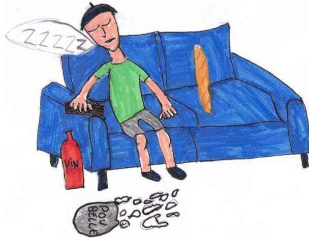
Dessin de Paul

V ous êtes-vous déjà demandés ce que pensaient les autres nations de nous, les Français ? Oui...ou alors non ? De toute façon, pas le choix, nous allons quand même parler aujourd'hui des stéréotypes concernant les Français !