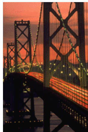
Légende accompagnant l'illustration.

Une fois votre bulletin terminé, vous n'aurez plus qu'à le convertir en site Web et à le publier.