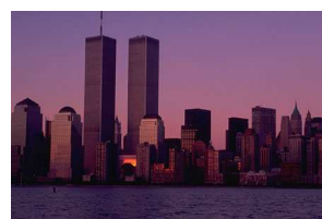
Légende accompagnant l'illustration.