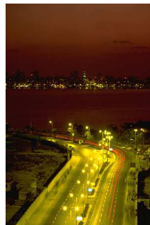
Légende accompagnant l'illustration.

Le contenu de votre bulletin peut également être utilisé pour votre site Web. Microsoft Publisher vous offre un moyen simple de convertir votre bulletin en site Web. Une fois votre bulletin terminé, vous n'aurez plus qu'à le convertir en site Web et à le publier.