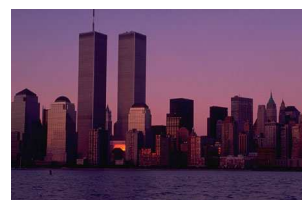
Légende accompagnant l'illustration.

Indiquez la personne à contacter pour obtenir de plus amples renseignements sur votre organisation.