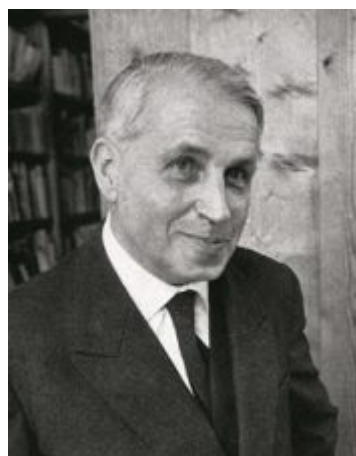
Portrait de Bataille en 1943.