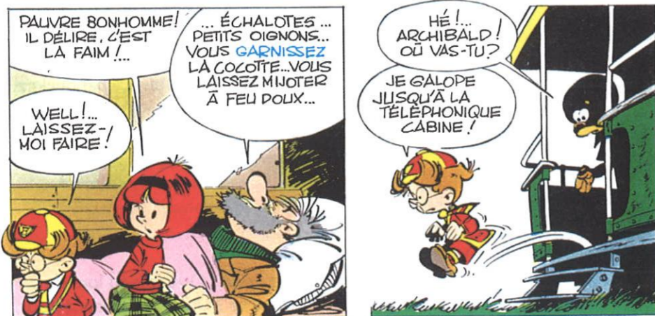
J. ROBA, La Ribambelle, © Studio Boule et Bill, 2012.