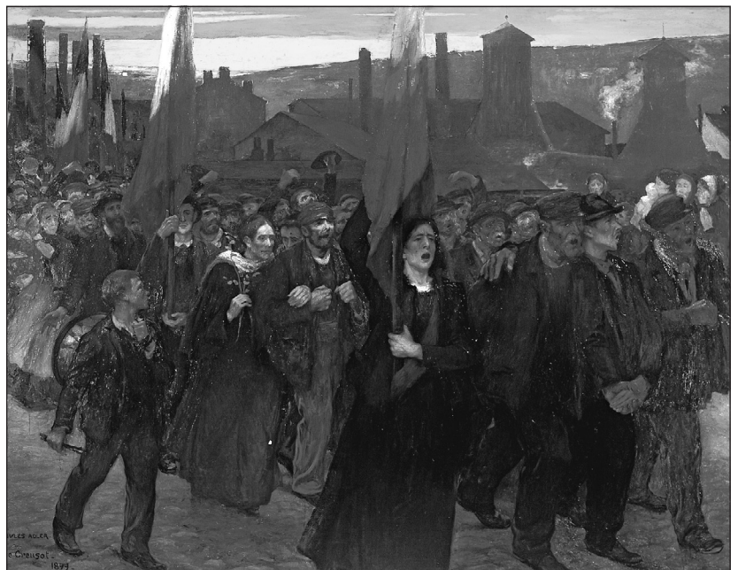
Doc. 4 Les ouvrières et ouvriers se réunissent dans des syndicats pour obtenir des droits sociaux. Pour cela ils arrêtent de travailler : c'est la grève. Jules Adler, Grève au Creusot , 1899.