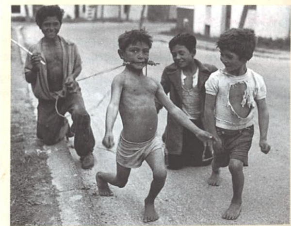
S. WEISS, Enfants jouant au cheval , Espagne, 1954.