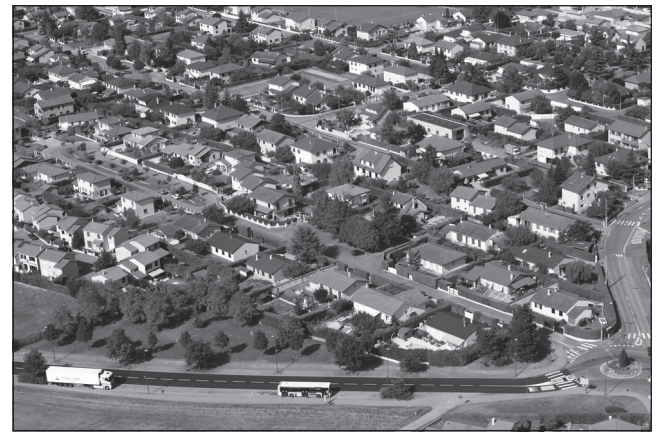
Doc. 3 Un quartier de lotissements.