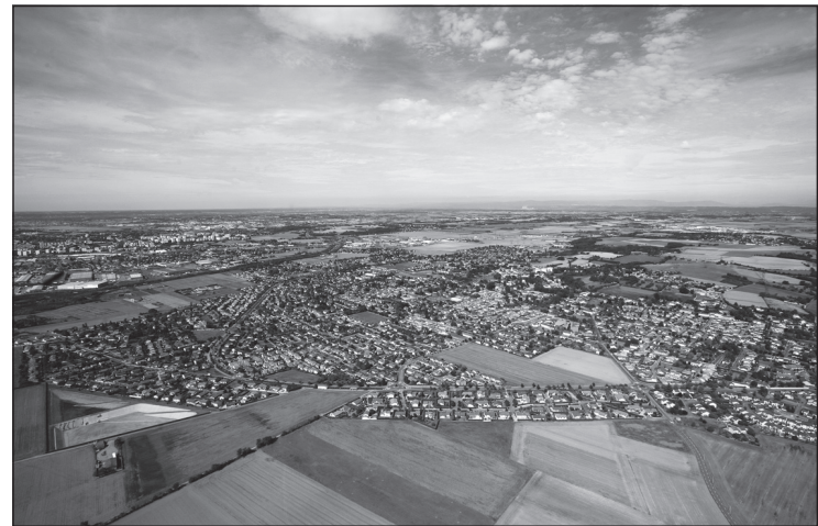
Doc. 2 Photographie aérienne de Mions.

Dans les années 1970, avec la généralisation de l'usage de la voiture les gens se sont installés dans les campagnes, en périphérie des grandes villes, dans de nouveaux quartiers de maisons individuelles qu'on appelle des lotissements. Dans certaines de ces communes, comme à Mions, on voit encore des traces d'activités agricoles (une ferme dans le centre de la petite ville, des champs aux alentours). Aujourd'hui, les distinctions entre villes et campagnes ne sont plus aussi nettes qu'auparavant.