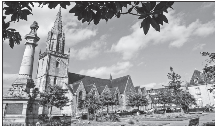
Doc. 2 La place Anne de Bretagne.