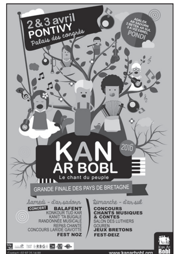
Doc. 5 Affiche pour une fête de la musique bretonne.

1. À partir de ces documents, quelles premières hypothèses peux-tu faire à propos de Pontivy ?