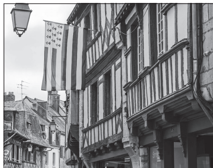
Doc. 4 Une maison à colombages datant du Moyen Âge.