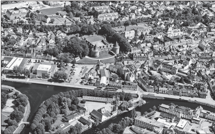
Doc. 6 Vue aérienne de Pontivy.