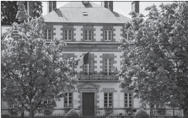
Doc. 1 La mairie.