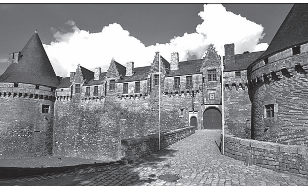
Doc. 3 Le château des Rohan.