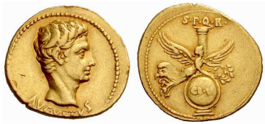
Aureus à l'effigie d'Auguste