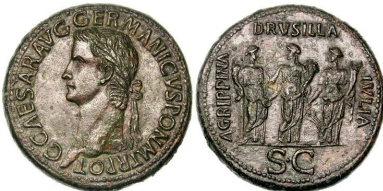
Denier à l'effigie de Caligula