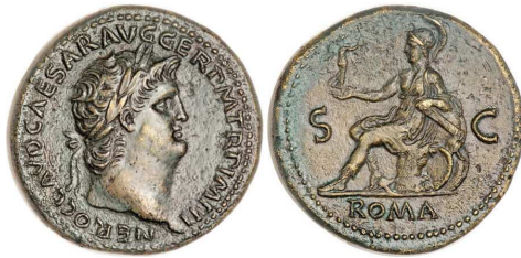
Sesterce à l'effigie de Néron