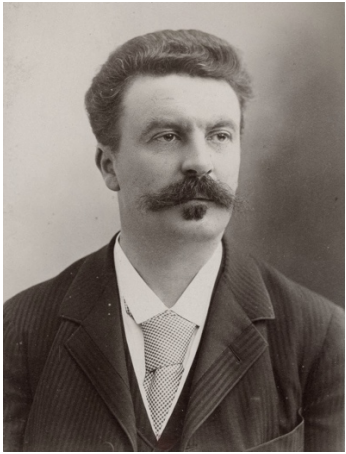
Photographie de Guy de Maupassant