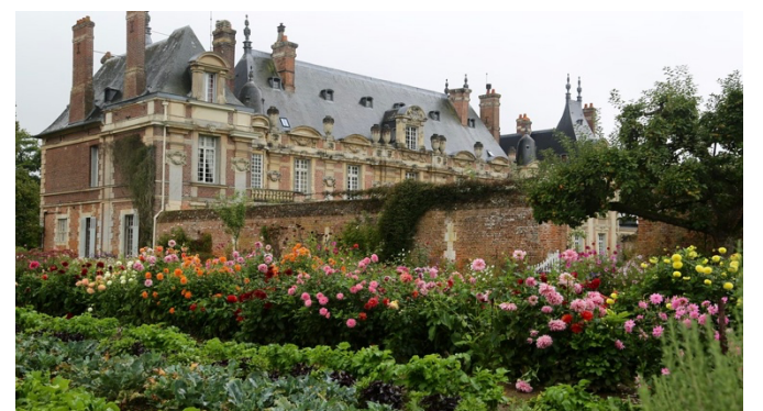
Château de Miromesnil lieu de naissance de Guy de Maupassant