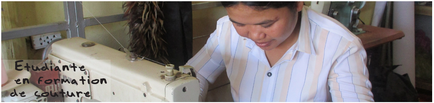
Etudiante en formation de couture