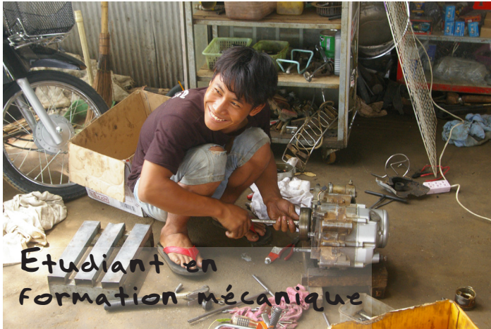
Etudiant en formation mécanique