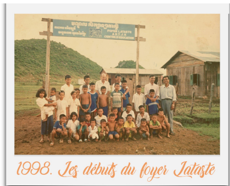
1998. Les débuts du foyer Lataste

Nous étions entourés par la forêt, le marché n'existait plus, les boutiques étaient vides, comme si le temps s'était arrêté. Les routes de terre étaient impraticables, notamment en saison des pluies où elles se transformaient en rivières de boue. Nous n'avions pas de voiture mais seulement deux petites motos et une charrette tirée par un cheval pour aller se ravitailler, emmener les enfants à l'école ou chercher du bois pour la cuisine. Nous n'avions aucun point d'eau, ni douche, ni toilettes... Nous devons aller chercher de l'eau potable en bouteille à quelques kilomètres. Par la suite, nous avons drainé un bassin. De cette manière nous faisons bouillir l'eau au bois pour la rendre buvable.