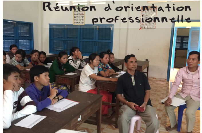
Réunion d'orientation professionnelle