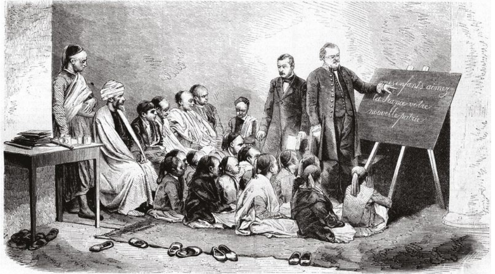
Illustration d'une école publique de garçons en Algérie, 1858. Sur le tableau, il est inscrit "Mes enfants aimez la France votre nouvelle patrie."