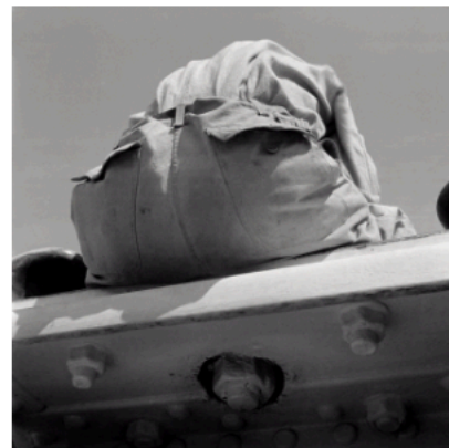
Passager d'un bateau 1937