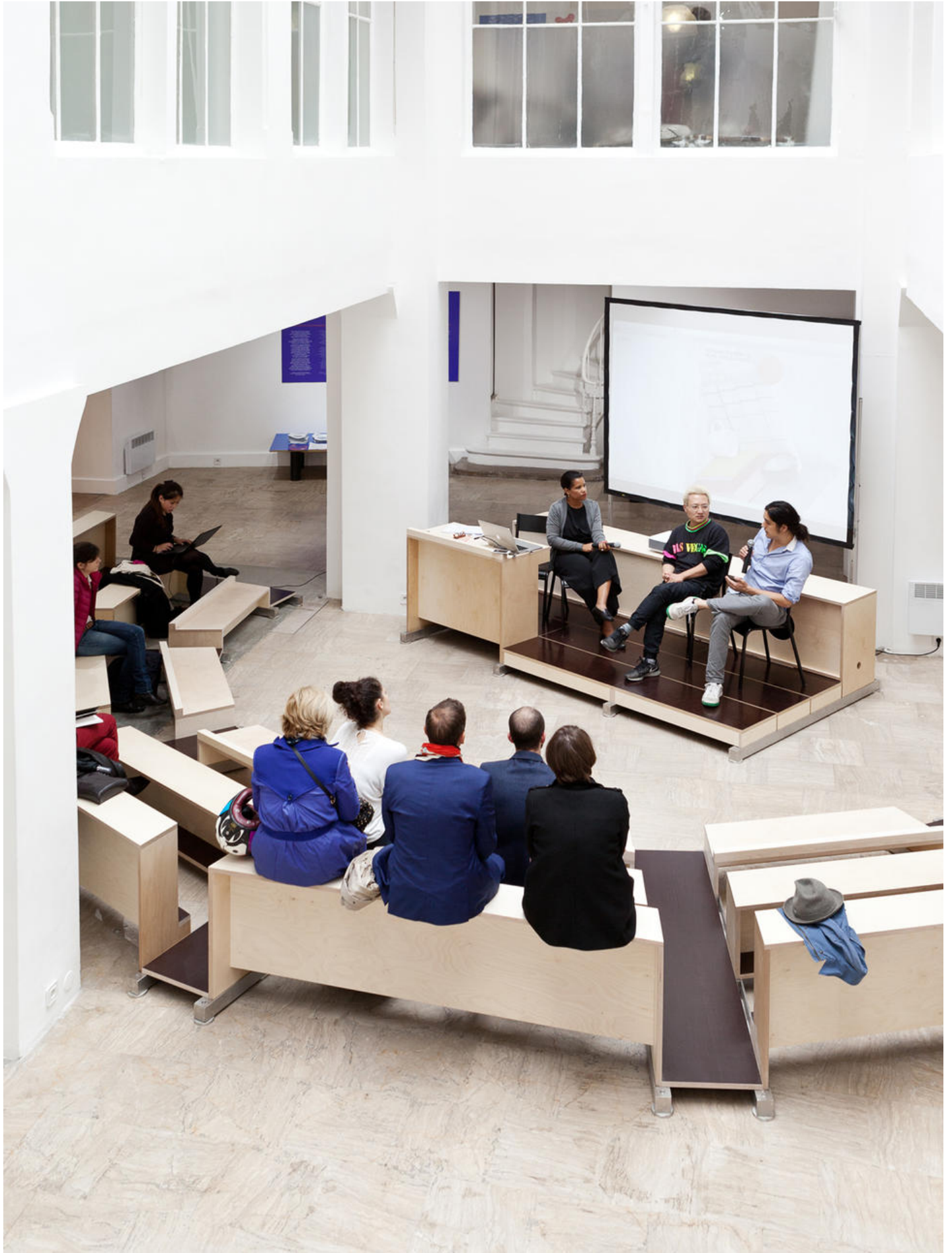
Conférence du forum Think Life, Share and Learn à l'occasion du festival D'Days (30 mai au 5 juin 2016).