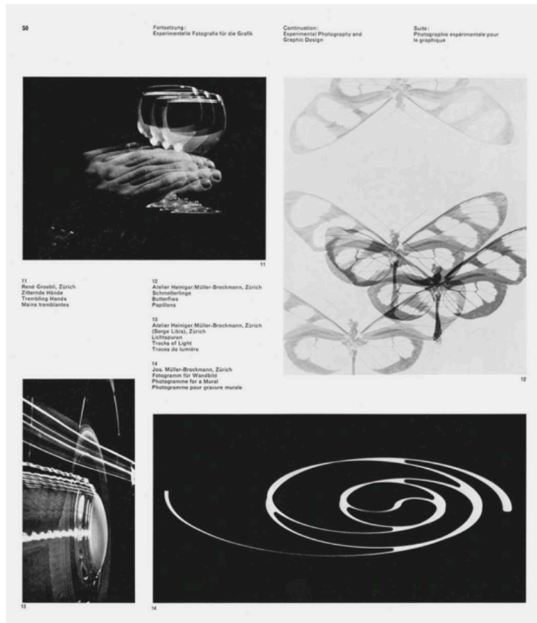
Josef Muller Brockmann