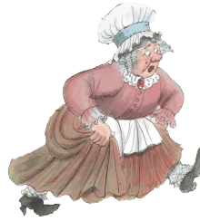
LA BONNE PETITE VIEILLE