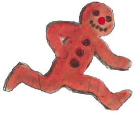
LE BONHOMME PAIN D'ÉPICES