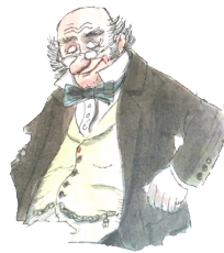
LE BON PETIT VIEUX