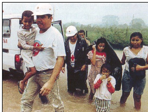
Doc.6 : La Croix-Rouge au Honduras après le passage du cyclone Mitch, 1998

Amnesty International redit sa préoccupation devant « l'incarcération de milliers de prisonniers d'opinion, le recours à la torture et aux mauvais traitements pendant la détention secrète, les procès inéquitables ». Le Monde. 4.11. 1998.