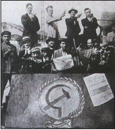
Doc.1 : Occupation d'usines à Turin, 1920

Doc.2 : Les conséquences de la Première Guerre mondiale en Italie : une triple crise