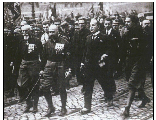
Doc.8 : La marche sur Rome, octobre 1922

7- Mussolini va vite imposer une dictature (doc.4).