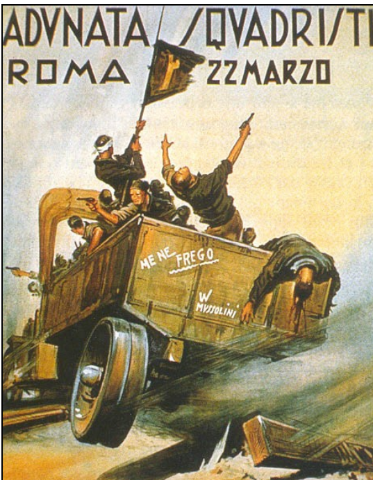
Doc.6 : Les squadristes en action

entourant une hache, qui symbolisait le pouvoir dans la Rome antique.