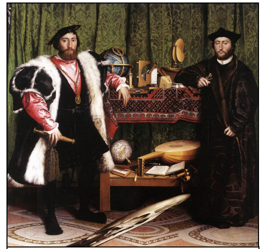
Doc.3 : Les ambassadeurs Jean de Dinteville et Georges de Selve, Hans Holbein le Jeune (1533)

- Héliocentrisme : la terre tourne autour du soleil (en un an) et sur elle-même