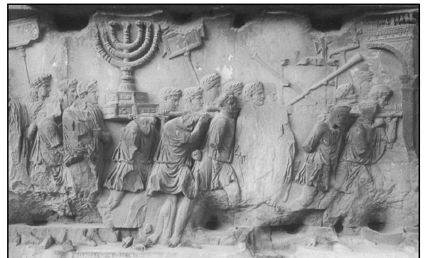
Doc.2 : Bas-relief de l'arc de triomphe de Titus, Rome, 70 après J.-C. (Hachette 2000)