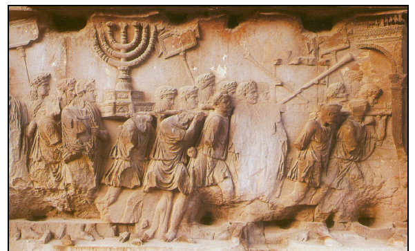
Doc.2 : Bas-relief de l'arc de triomphe de Titus, Rome, 70 après J.-C. (Hachette 2000)