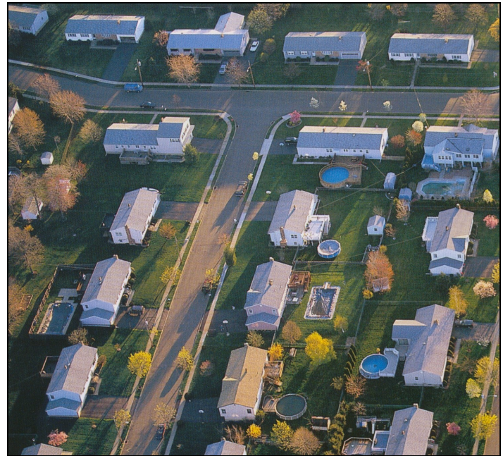
Doc.2 : Paysage de New Haven