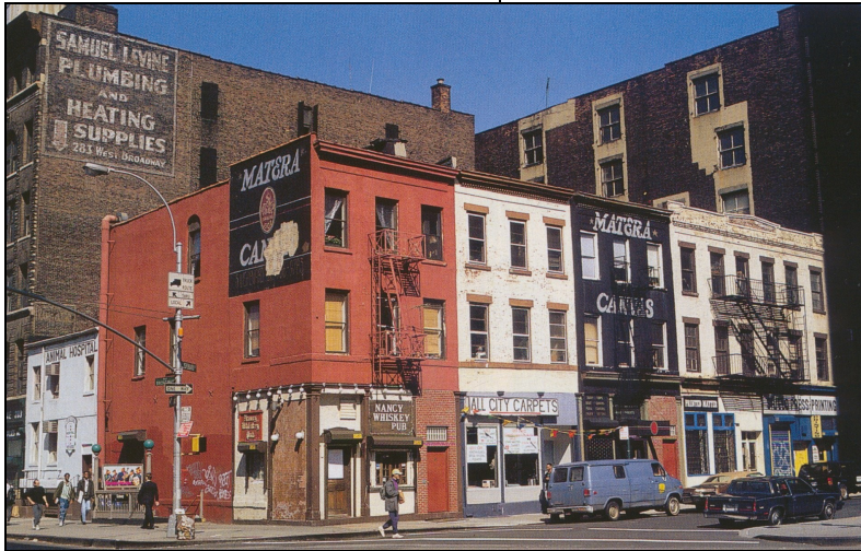
Doc.1 : Un paysage du Bronx