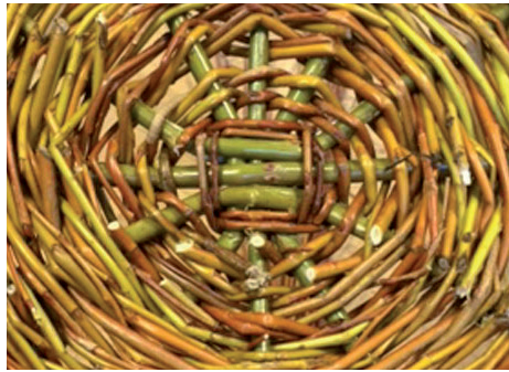
Tressage d'osier Métier à tisser vertical