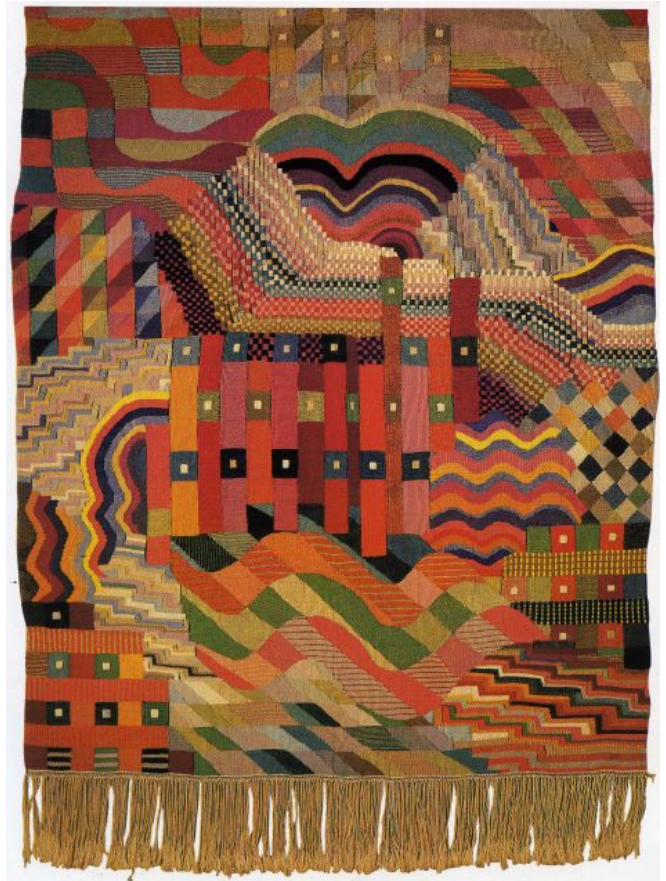
Wassily chair, Marcel Breuer, Théière, Marianne Brandt, Tapissierie Gunta Stolzl,