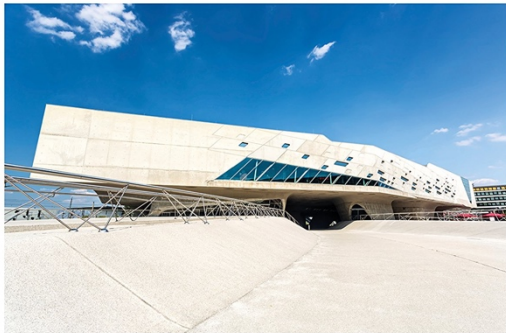
Museum in the form of a laboratory: Phaeno in Wolfsburg Architect: Zaha Hadid (2005)

https://journals.openedition.org/ocim/373#ftn1