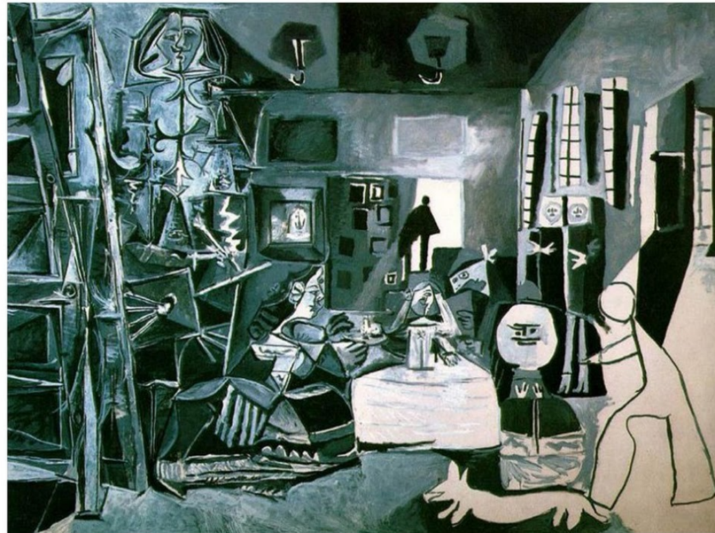
Pablo Picasso, 1957