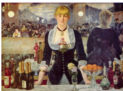
Un bar aux Folies-Bergère, Manet, 1881-1882