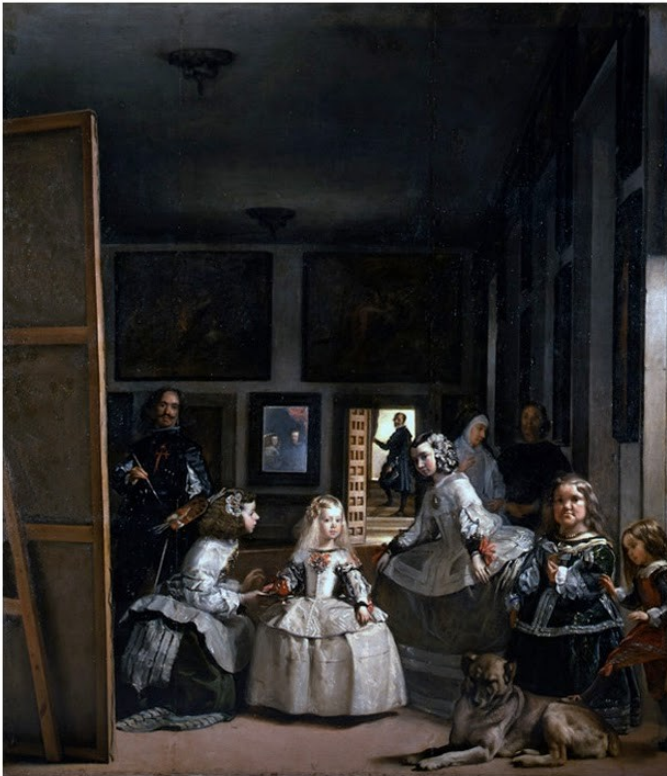
Diego Vélasquez, 1656