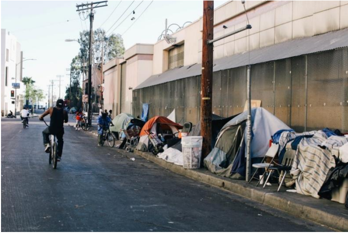
← Document n°4 – Le ghetto de Skid Row (Downtown)

Situé dans le centre de Los Angeles, le ghetto de Skid Row compte près de 20 000 habitants, dont 3000 à 6000 sans abris.