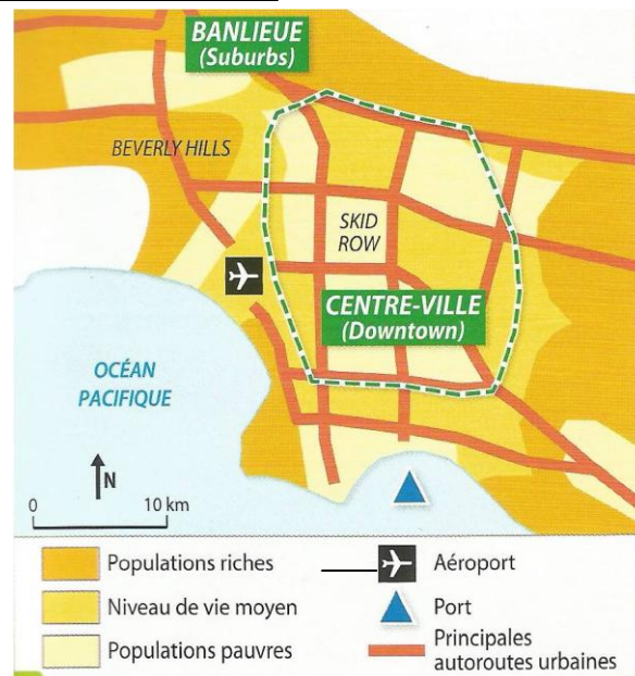
Document n°2 – Plan de Los Angeles →

Downtown : le centre ville aux Etats-Unis, comprenant le CBD et les quartiers autour