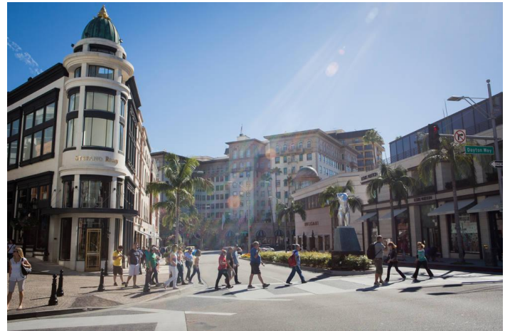
Document n°5 - Le quartier de Beverly Hills (suburbs) →

Situé dans le centre de Los Angeles, le ghetto de Skid Row compte près de 20 000 habitants, dont 3000 à 6000 sans abris.