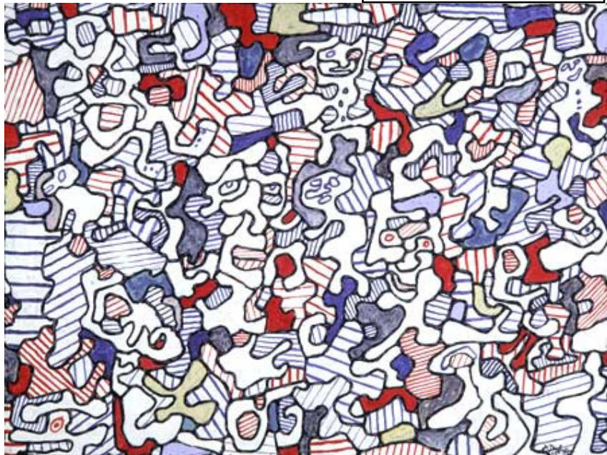
Allées et venues-1965