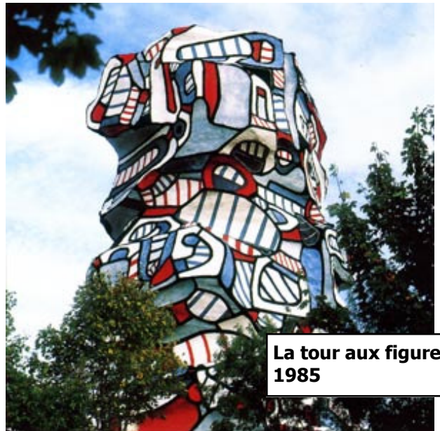
La tour aux figures 1985