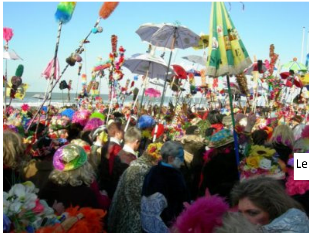
Le carnaval de Dunkerque