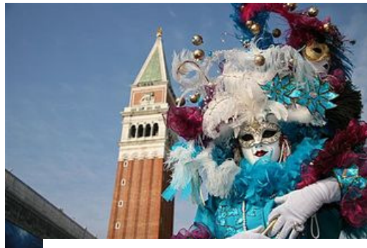
Carnaval de Venise (Italie)