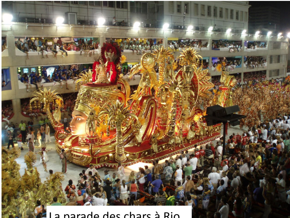
La parade des chars à Rio