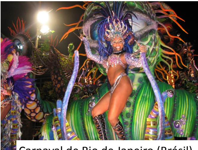
Carnaval de Rio de Janeiro (Brésil)

Les plus connus au monde sont le carnaval de Rio au Brésil et le carnaval de Venise en Italie. En France le plus cité est le carnaval de Dunkerque