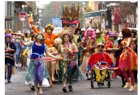
Carnaval de Dunkerque (France)