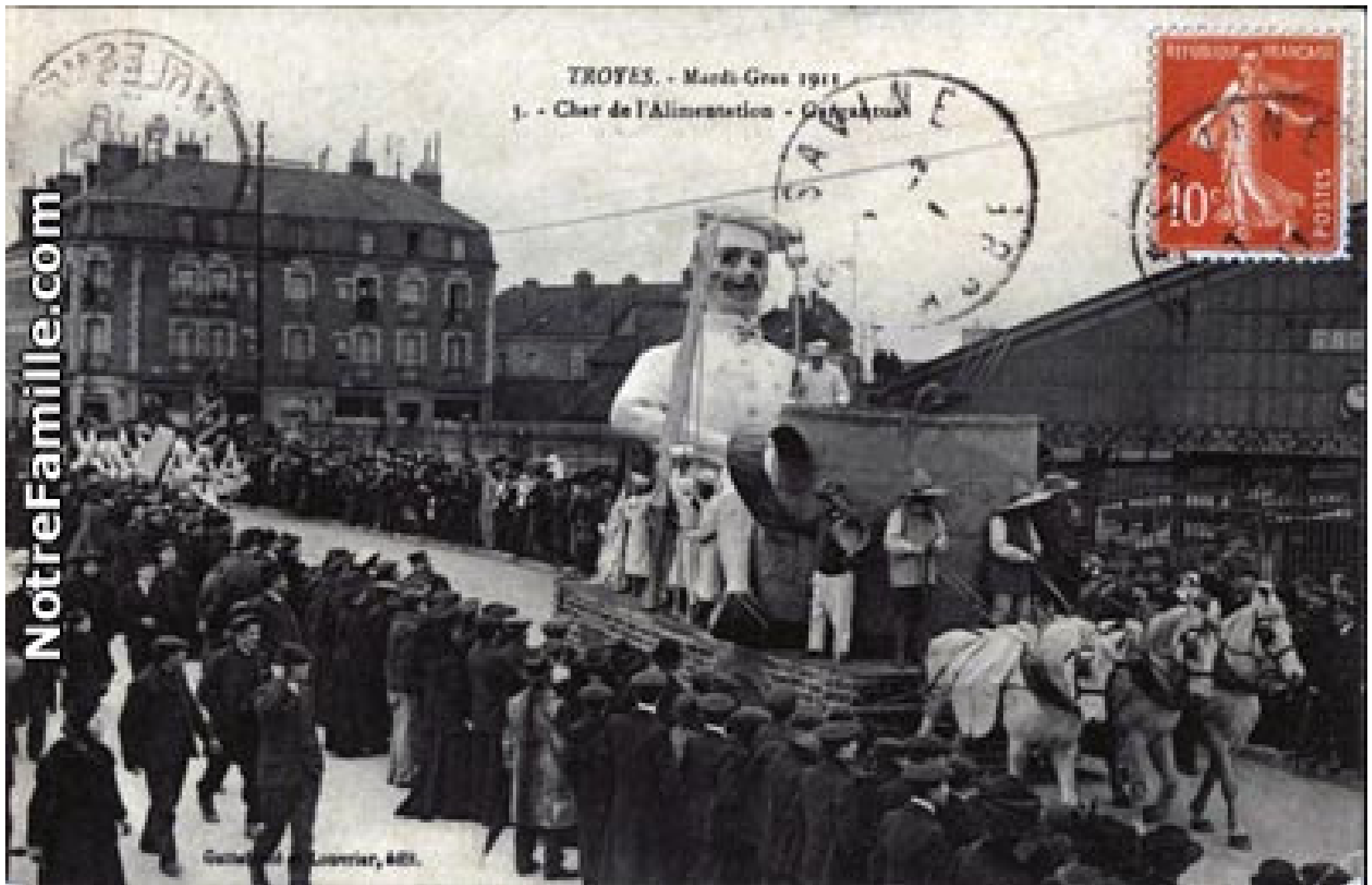
Mardi gras à Troyes en 1911