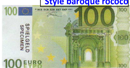
Style baroque rococo