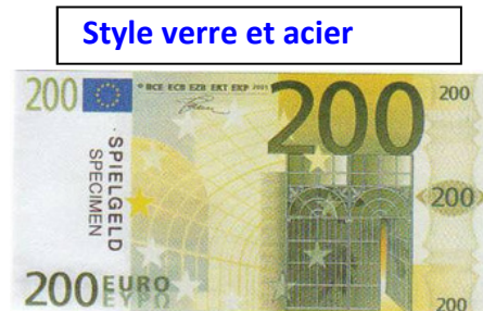
Style verre et acier