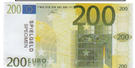
Style verre et acier