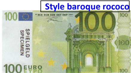
Style baroque rococo