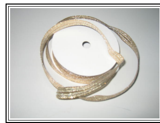
Un joli ruban de fête