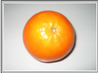
Une belle orange