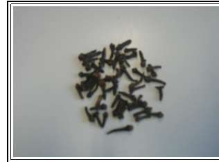
Des clous de girofle