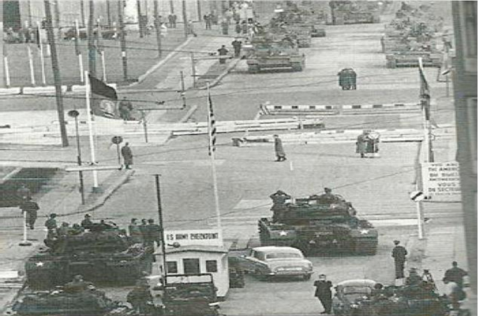
Document 1 page 126, Manuel de 1ère Nathan , Col G. Le Quintec, 2011