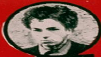
WASJBROT JUIF POLONAIS 1 ATTENTAT - 2 DÉRAILLEMENTS