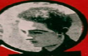
ELEK JUIF HONGROIS & DÉRAILLEMENTS