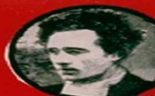
WITCHITZ JUIF POLONAIS 15 ATTENTATS