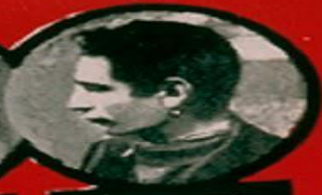
FINGERWEIG JUIF POLONAIS 2 ATTENTATS - 8 DÉRAILLEMENTS