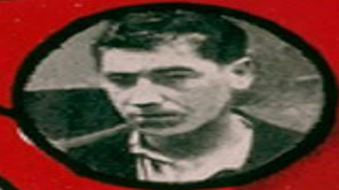
FONTANOT COMMUNISTE ITALIEN 12 ATTENTATS