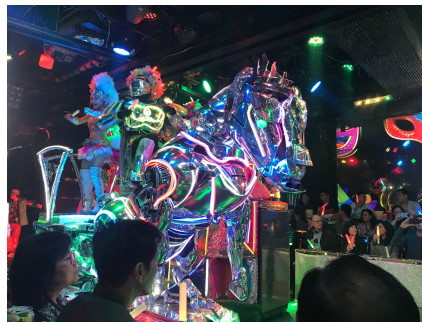
Le Restaurant des Robots