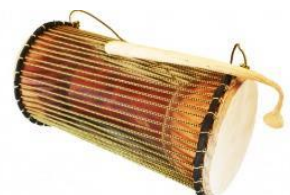
Un tama (appelé aussi tambour parlant)