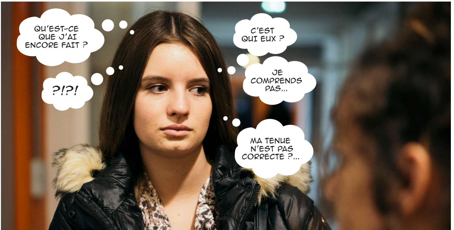
Elle rentre en cours gênée, sous le regard insistant de ses camarades.