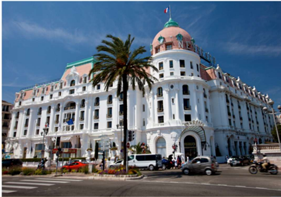
6c. Hôtel Negresco 5* construit en 1913