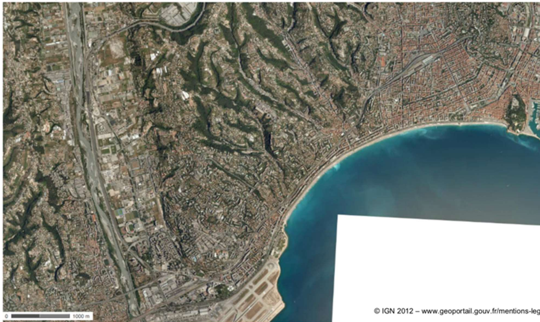
Image satellite de Nice