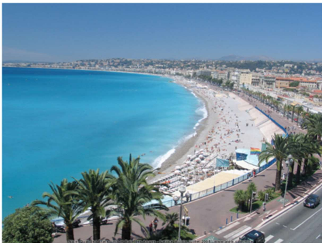
6b. Vue générale